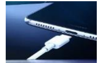
手機USB端子水下插拔