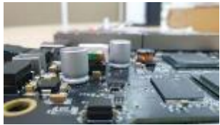
工控板/線圈絕緣耐高電壓