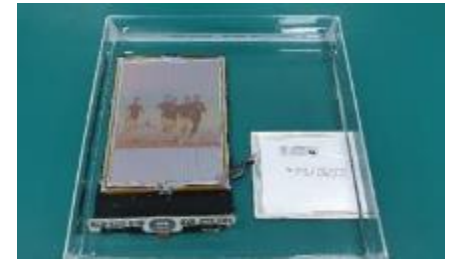
電子書水下操作撥放