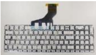
鍵盤 & 工控端子抗硫化