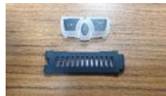
矽橡膠抑制細菌滋長